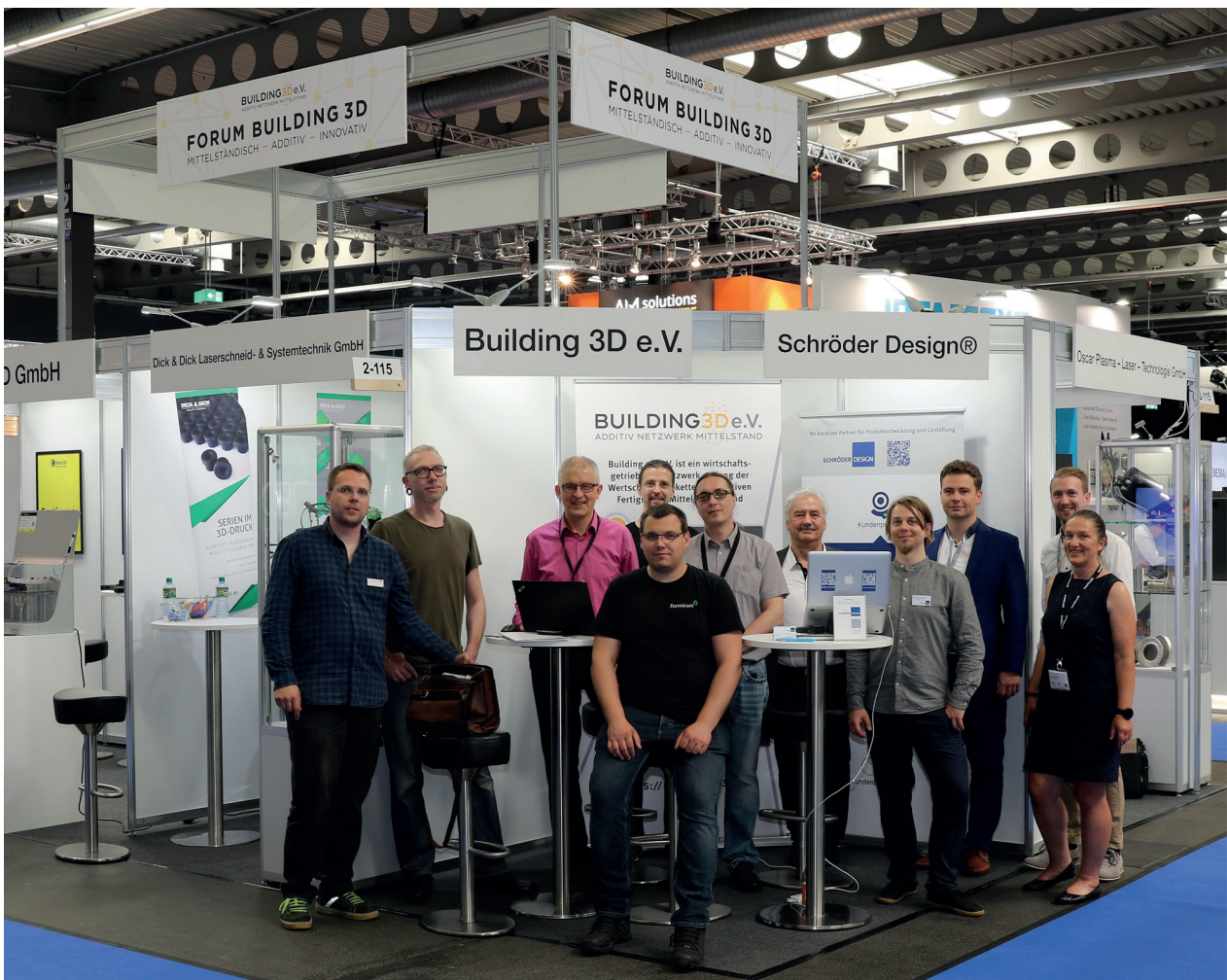
Forum Building 3D in Erfurt

Diese und weitere Fragen können im Foyer der Messe Chemnitz am 28. und 29. September 2022 auf dem Gemeinschaftsstand des Building 3D e.V im Rahmen der Messe all about automation besprochen werden. Wir bieten Lösungen von und für den Mittelstand.